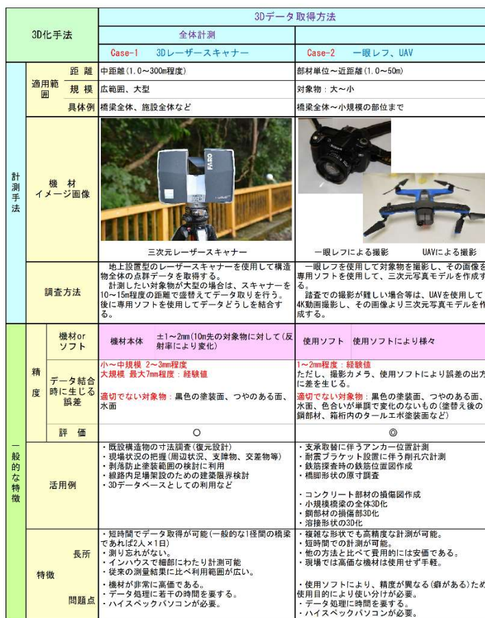
表-1 三次元データ取得機材とその特徴

一般的に現場の三次元データを取得するには三次元レーザー scanner で点群を取得する方法と、デジタルカメラで画像を取得し画像から三次元モデルを作成する方法がある。前者は広範囲のデータを短時間で取得し形状を把握することが可能であり、データ処理に費やす時間も短い。後者は対象物や調査目的に応じて画像を取得する手段を選べ、損傷などの詳細な状況把握や形状計測が可能である。ただし、得られる情報は多いがデータ処理に時間を要する。各々の特性に応じて使い分けが必要となる。